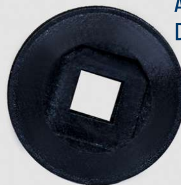
ACABAMENTO DE MAÇANETA