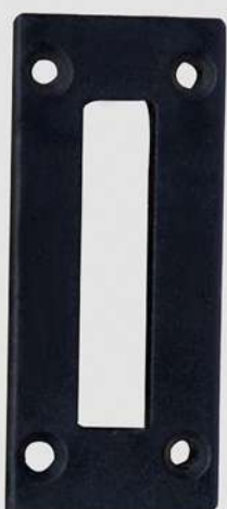
CONTRA TESTE DE FECHADURA