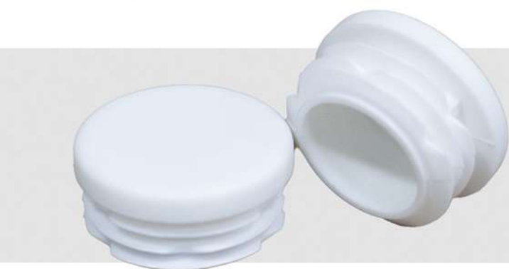
PONTEIRA PARA MÓDULO