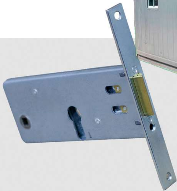
FECHADURA PARA MÓDULO