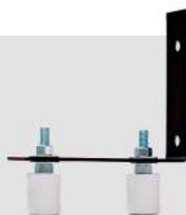
GUIA DE PORTÃO 2 ROLETES ● BRANCO - COD: 4426 ● PRETO - COD: 4425 ● FOSCO - COD: 4615 ● BRONZE - COD: 4612 ● ZINC - COD: 4701