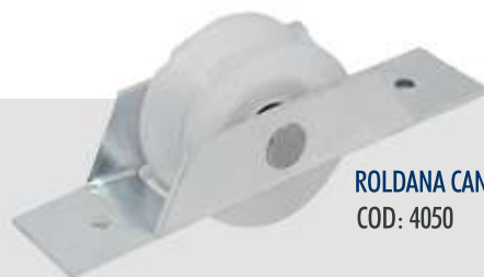
ROLDANA CANTONEIRA NYLON 2" COD: 4050