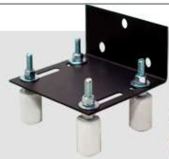
GUIA DE PORTÃO 4 ROLETES ● BRANCO - COD: 4408 ● PRETO - COD: 4407 ● FOSCO - COD: 4509 ● BRONZE - COD: 4642 ● ZINC - COD: 4648