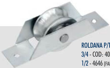
ROLDANA P/TUBO AÇO 2" 3/4 - COD: 4051 1/2 - 4646 (FANTASMINHA)