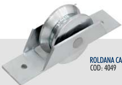
ROLDANA CANTONEIRA AÇO 2" COD: 4049