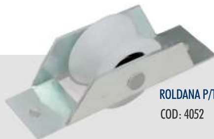
ROLDANA P/TUBO NYLON 2" COD: 4052